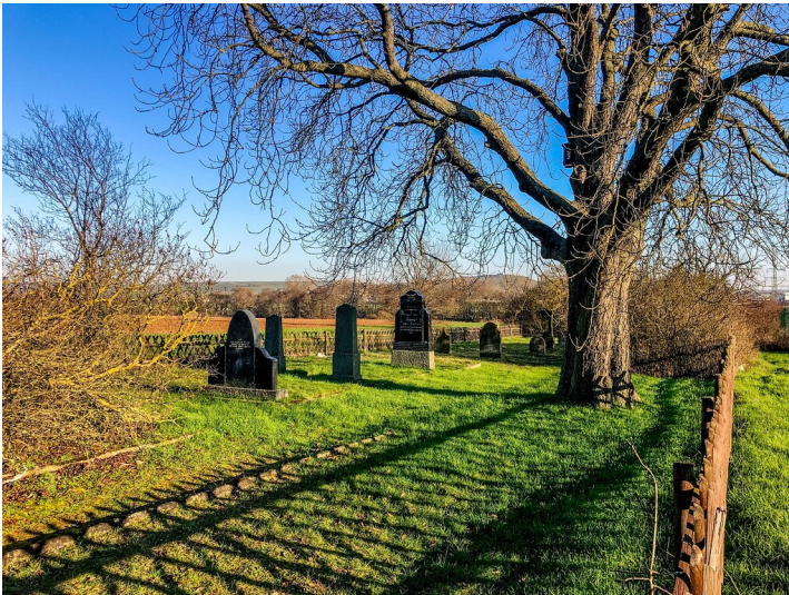
Der jüdische Friedhof im Johanneshohl in Bretzenheim (2023)