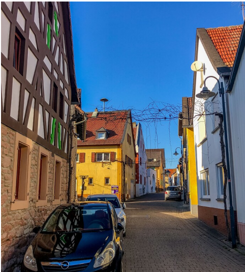
Blick in die Große Straße in Bretzenheim, in der sich einst die jüdische Betstube befand (2023)