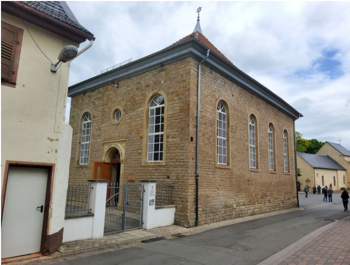
Die jüdische Synagoge in der Gymnasialstraße 9 in Bad Sobernheim (2023)