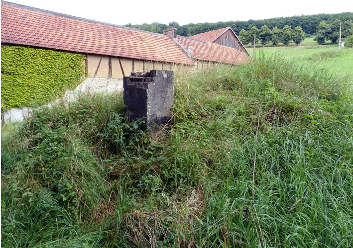
Schornstein des Kalkofens am Weinberger Hof bei Dörrebach (2016)