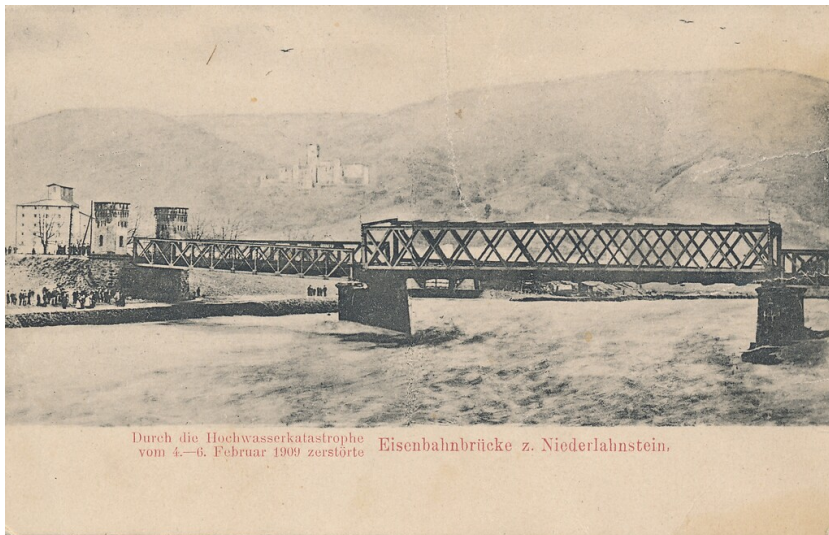
Durch die Hochwasserkatastrophe vom 4.–6. Februar 1909 zerstörte Eisenbahnbrücke z. Niederlahnstein.

Eisenbahnbrücke von 1863 bis 1909