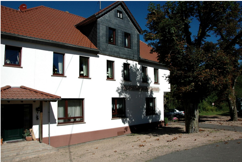
Frontansicht des Gasthofes am Bahnhof in Nonnweiler-Schwarzenbach (2016).