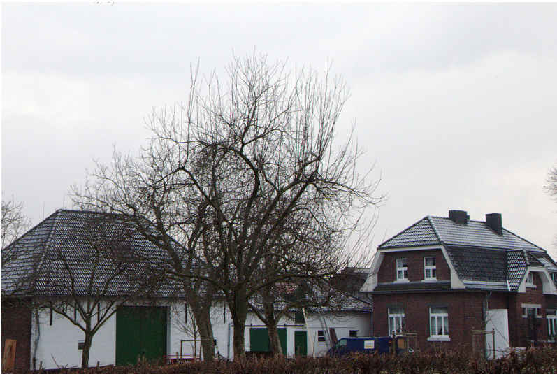
Gut Große Gasse (2015)