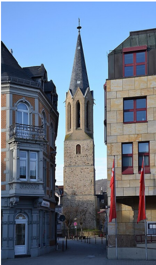
Der heute isoliert stehende Kirchturm der ehemaligen Wilhelmskirche in der Innenstadt von Bad Kreuznach (2013).