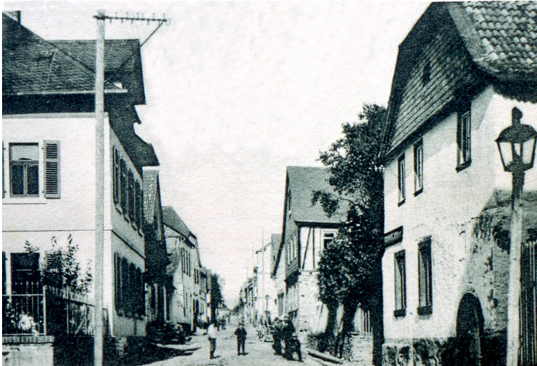
Alte Ansicht der Stromberger Straße in Dörrebach, um 1900