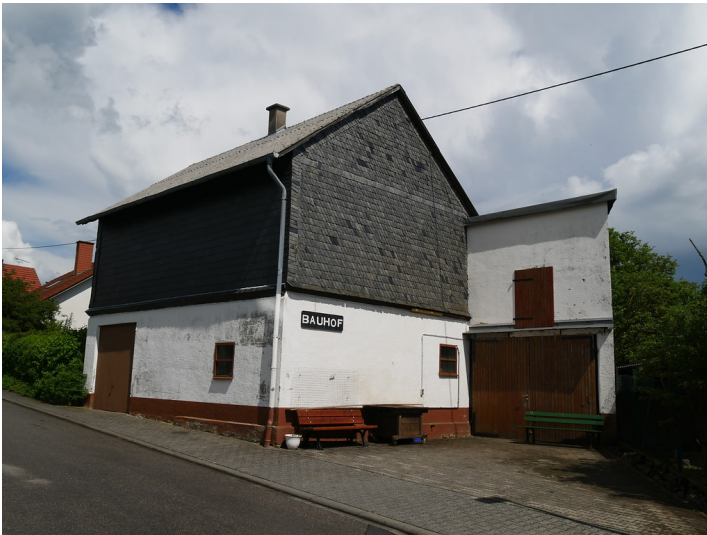
Bauhof der Gemeinde Dörrebach, Blickrichtung Westen (2017)