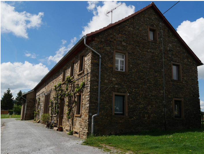
Hauptgebäude des Landwirtschaftsbetriebes "Im Pfädchen 10" in Dörrebach, Blickrichtung Nordwesten (2017)