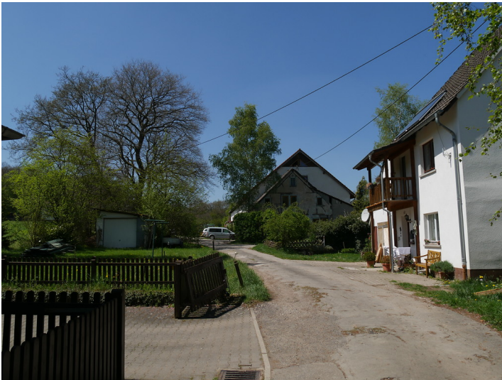
Gebäude des Hofgutes Lehmühle bei Schöneberg (2017)