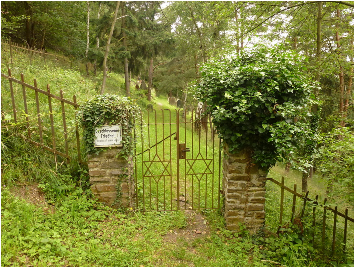
Jüdischer Friedhof "An der Grauen Lay" in Oberwesel (2016)