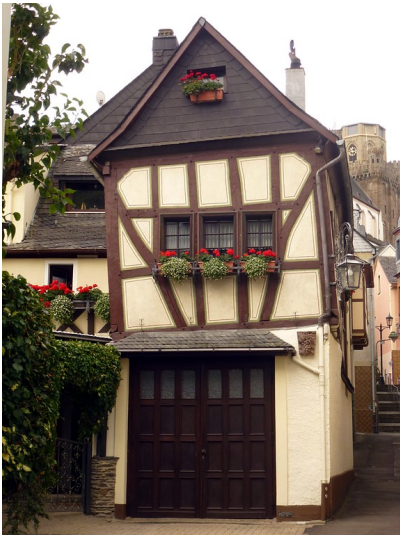
Wohnhaus in der Steingasse 4 in Oberwesel (2016)