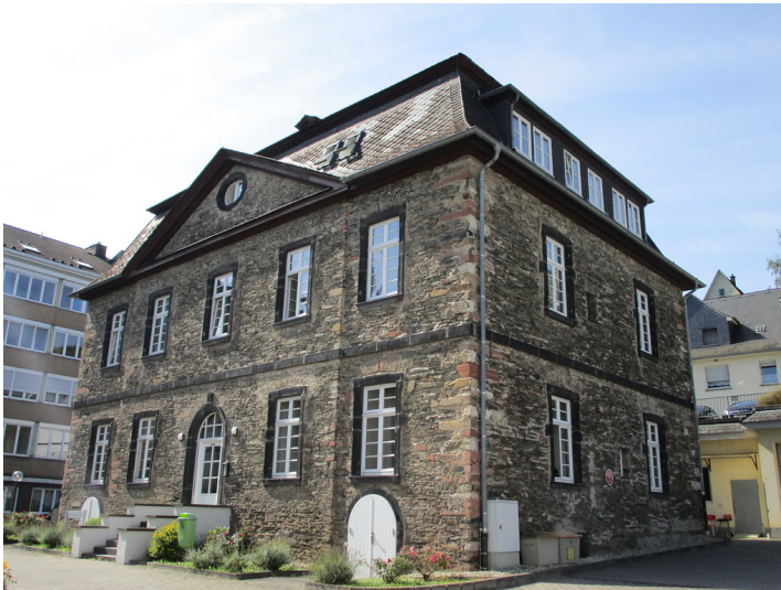
Von der Leyenscher Hof in Oberwesel (2016): Das zweigeschossige, heute unverputzte herrschaftliche Gebäude stammt aus dem ersten Drittel des 18. Jahrhunderts.