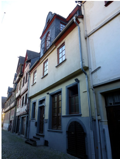
Wohnhaus in der Rheinstraße 5 in Oberwesel (2016)