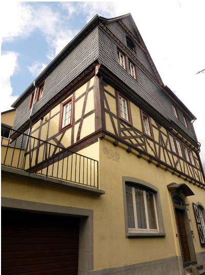
Wohnhaus in der Rheinstraße 7 in Oberwesel (2016)