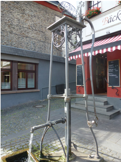
Brunnen im Zentrum von Oberwesel (2016)