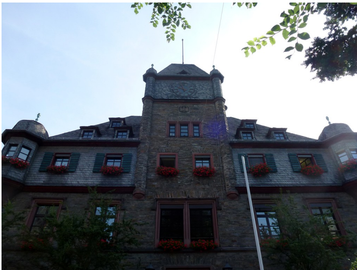
Rathaus in Oberwesel (2016): Das Rathaus am heutigen Standort wurde 1847-1850 im Stil einer Wehrburg gebaut.