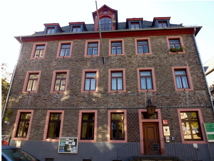
Das Ärztehaus mit der städtischen Touristinformation im Zentrum der Stadt Oberwesel (2016)