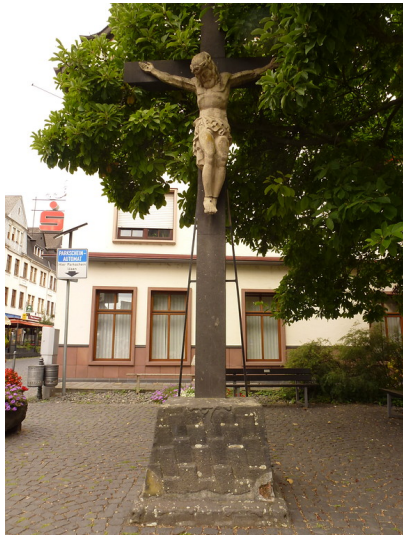
Marktkreuz in Oberwesel (2016): Der Korpus wurde 1948 nachgebildet, da das Original nicht mehr erhalten ist.