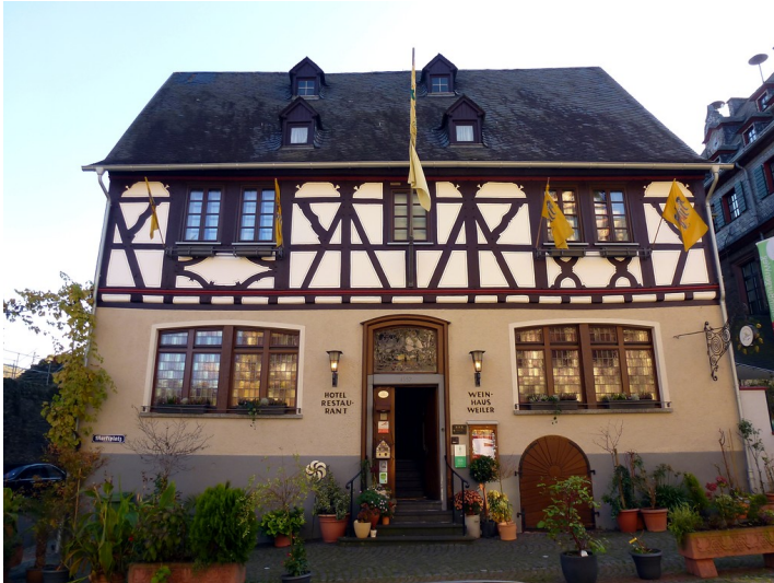
Weinhaus Weiler in Oberwesel (2016)