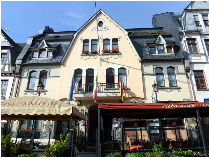
Wohnhaus in der Rathausstraße 9 in Oberwesel (2016): Heute zählt das Objekt zu den wenigen Bauten mit Jugendstilelementen.