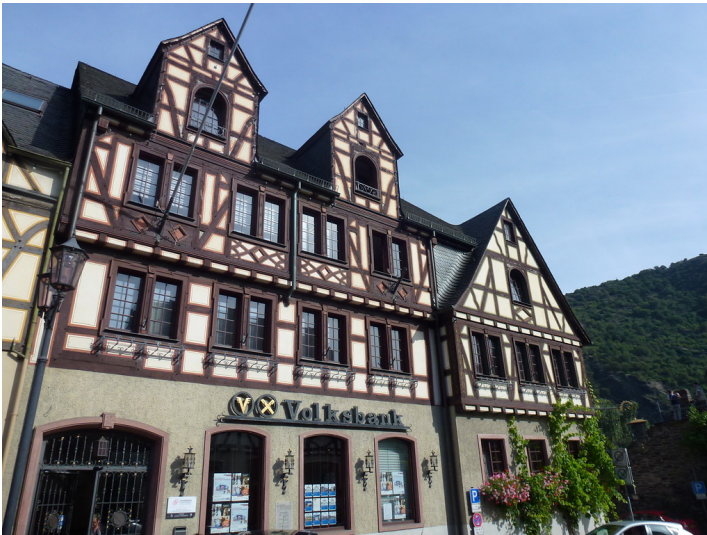
Fachwerkhaus am Marktplatz 3-5 in Oberwesel (2016). Der Gebäudekomplex wurde zwischen 1799 und 1981 gebaut und ist den ursprünglichen Gebäuden aus der 2. Hälfte des 17. Jahrhunderts nachempfunden.