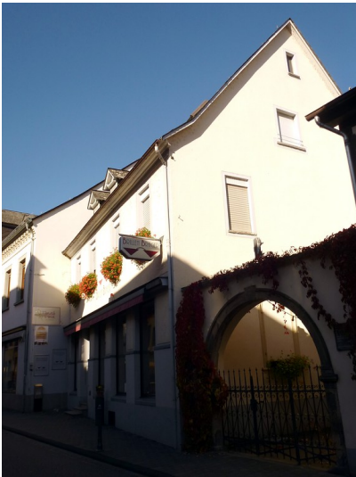
Wohnhaus an der Rathausstraße 16 in Oberwesel (2016): Zu dem Haus gehört auch ein Hof, über den das Haus betreten werden kann.