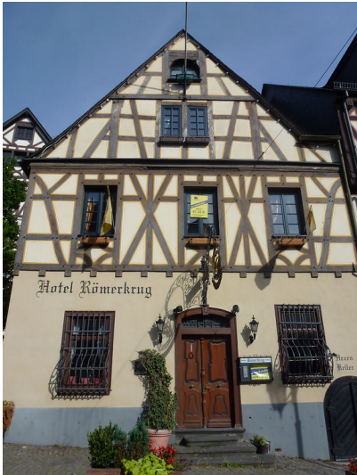
Fachwerkhaus am Marktplatz 1 in Oberwesel (2016)