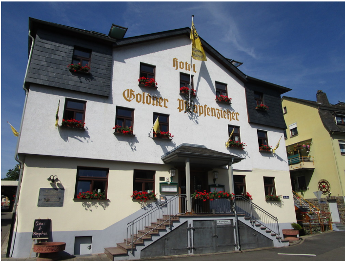
Hotel "Goldener Pfropfenzieher" in Oberwesel (2016). Das Hotel in der nördlichen Vorstadt ist ein Nachbau des Gebäudes aus dem 19. Jahrhundert und befindet sich in Rheinnähe.