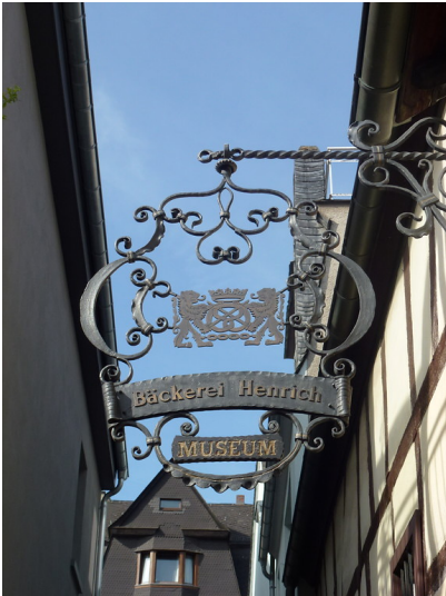
Schild am Wohnhaus in der Münzgasse 3 in Oberwesel (2016)