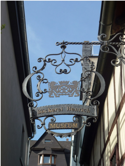
Schild am Wohnhaus in der Münzgasse 3 in Oberwesel (2016)