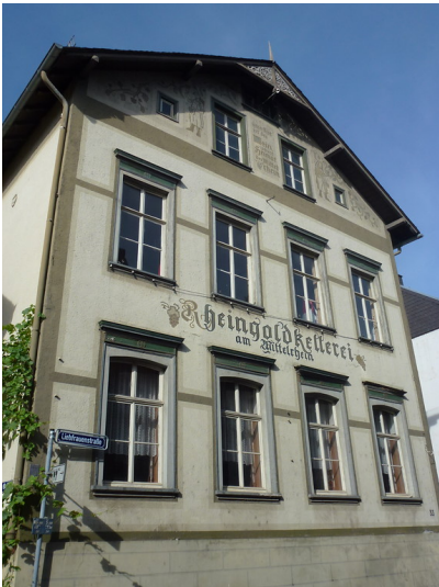
Wohnhaus in der Liebfrauenstraße 33 in Oberwesel (2016): Das Gebäude der Rheingoldkellerei ist heute ein Wohnhaus.