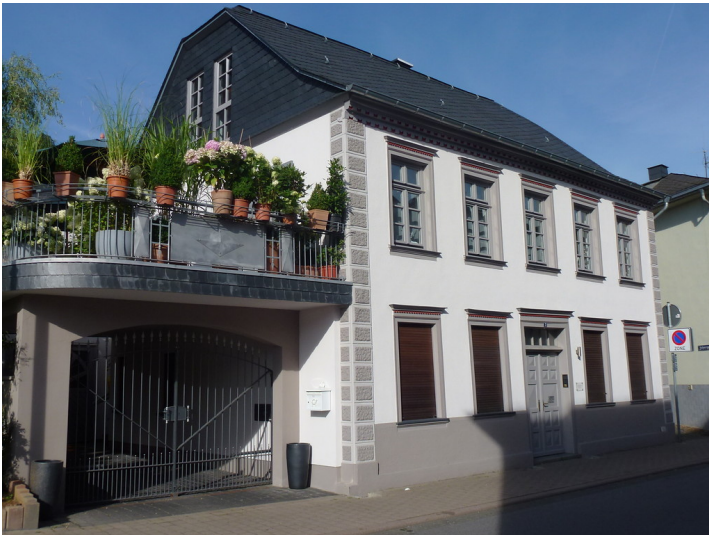
Wohnhaus in der Liebfrauenstraße 3 in Oberwesel (2016)