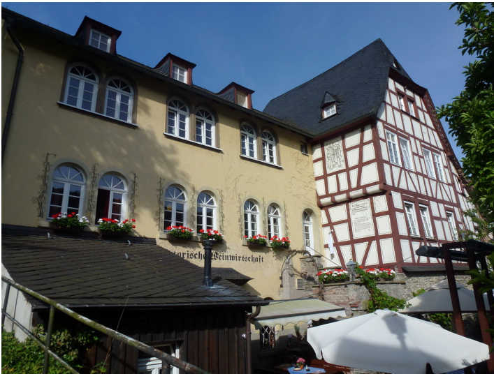
Kirchstraße 18 und 20 in Oberwesel (2016, Nr. 18 links, rechts davon Nr. 20). Im ehemaligen Kanonikerhaus befindet sich heute eine historische Weinwirtschaft.