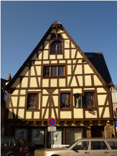
Das Fachwerkhaus in der Chablisstraße 5 in Oberwesel (2016). Der zweigeschossige, giebelständige Bau kann auf die erste Hälfte des 17. Jahrhunderts datiert werden, wie an der Jahreszahl 1626 im Giebel oberhalb der ehemaligen Ladeluke zu erkennen ist.