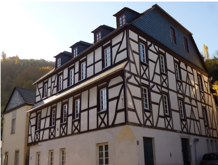
Fachwerkhaus in der Chablisstraße 9 in Oberwesel (2016). Das Objekt stammt wohl aus dem 19. Jahrhundert und wird auch Alte Mühle oder Kastors Mühle genannt.