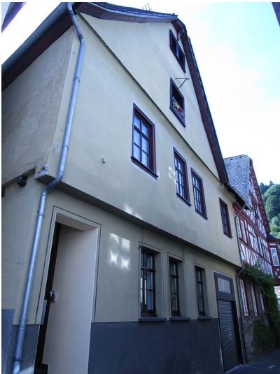
Wohnhaus in der Holzgasse 6 in Oberwesel (2016)