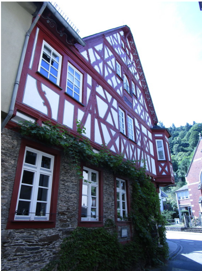
Fachwerkhaus in der Holzgasse 4 in Oberwesel (2016)