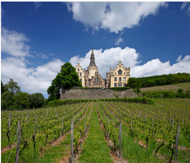
Bad Hönningen, Blick über Weinberge auf Schloss Arenfels (2011)