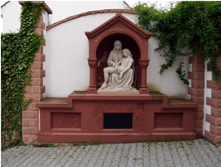
Frontansicht der Reste der ehemaligen Grabsätte der Familie Sonnet in Dörrebach (2016).