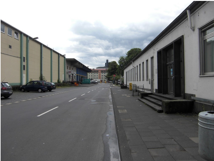
Die Marktstraße im Bereich des Großmarkts in Köln-Raderberg (2013). Auf dem Gelände befand sich früher der jüdische Friedhof "Judenbüchel".