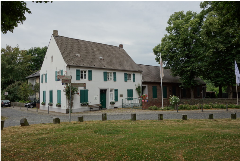
Ehemaliges Lehrerhaus Dorf Friemersheim (2016)