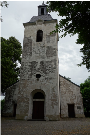
Evangelische Dorfkirche Friemersheim (2016)