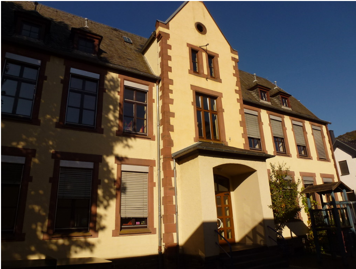
Elfenlay-Grundschule Oberwesel (2016)