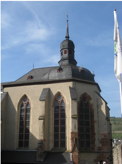
Mutter-Rosa-Kapelle in Oberwesel (2016)