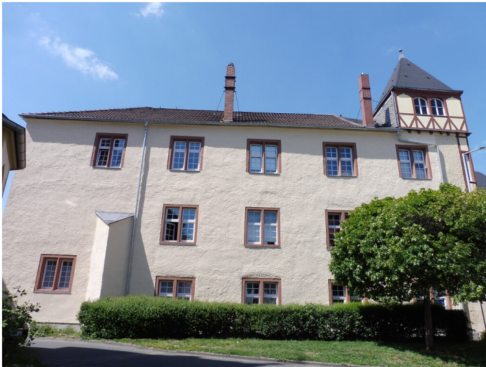
Salkellerei von Süden