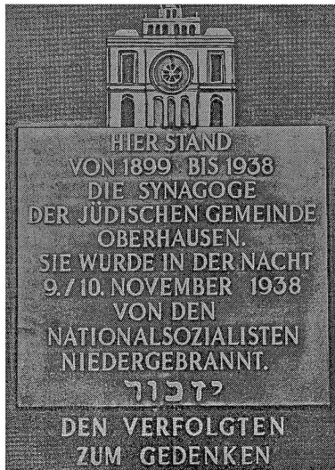
Synagoge Oberhausen, Gedenktafel am früheren Standort in der heutigen Friedenstraße (1987).