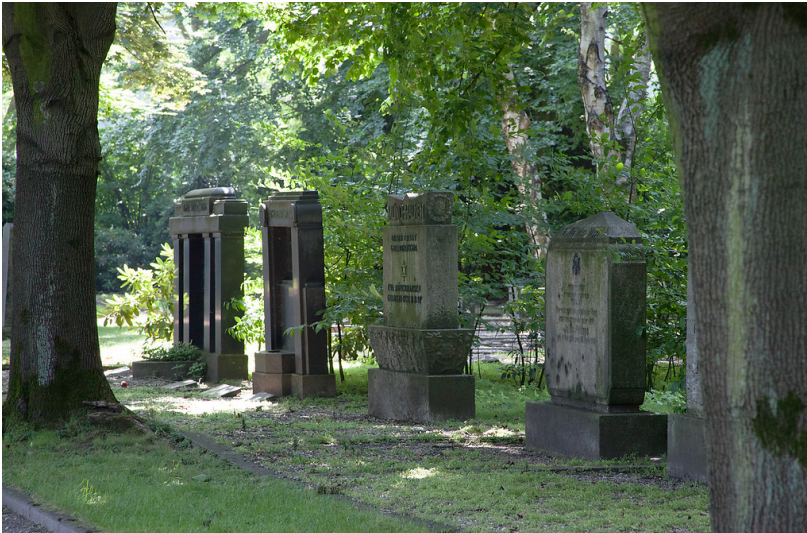
Oberhausen-Buschhausen, Jüdischer Friedhof auf dem evangelischen Friedhof