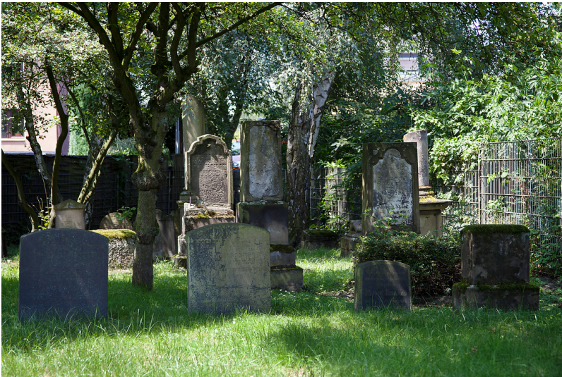
Oberhausen-Holten, Jüdischer Friedhof, Vennstraße