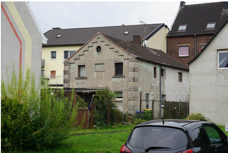
Ehemalige Synagoge bzw. jüdisches Bethaus in der früheren Kirchstraße in Oberhausen-Holten (2017).