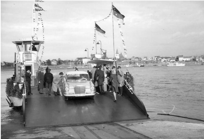
Jungfernfahrt der Fähre "Mondorf III" (1963).