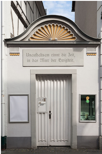
Das Eingangstor des "Cahnschen Hauses", der 1933 abgebrochenen jüdischen Synagoge; heute als Verbindungsmauer zwischen den Häusern in der Königswinterer Hauptstraße 395 und 397a erhalten (2013).